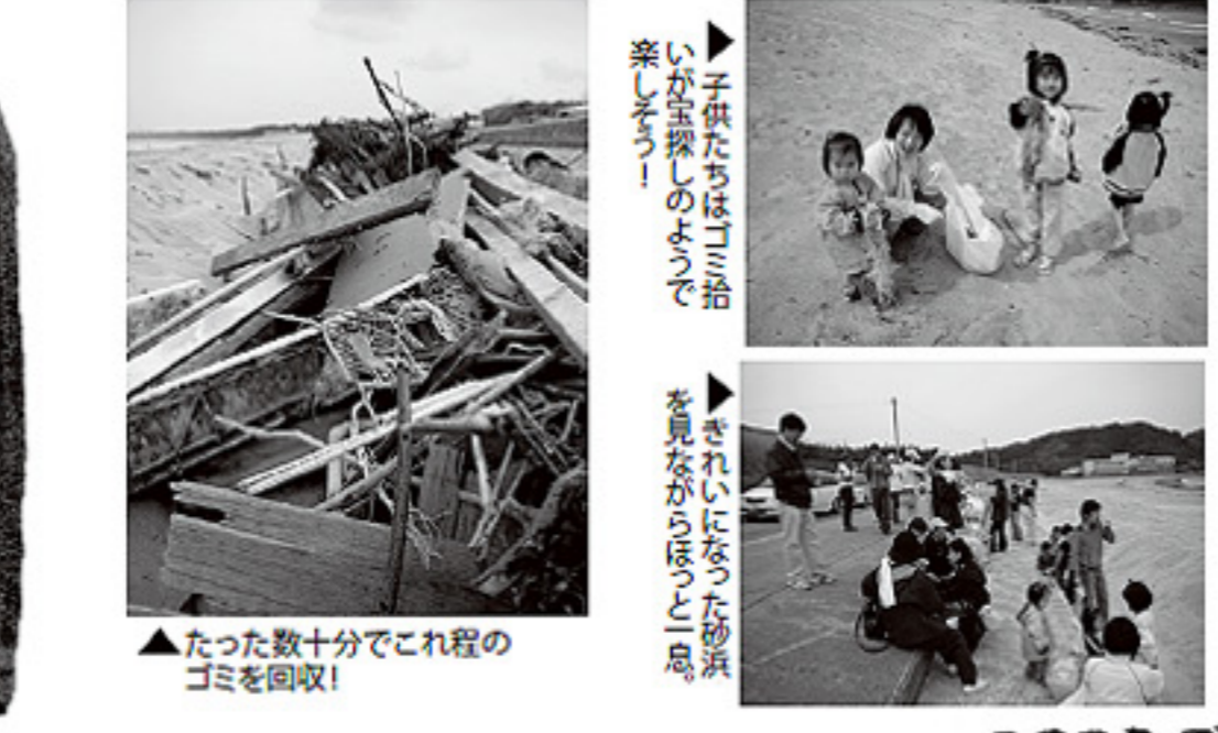
▲たった数十分でこれ程の ゴミを回収!

編集後記 皆さんお元気ですか? 今回の編集後記は皆様が担当です。 最近の出来事は「春の卵焼き」「鷹の爪栽培プロジ クト」など新しい事に先陣を切って先陣 しています。 いよいよ夏本番です。後は気温が上がる と共に気分も上向きしてくるんですよ。 今年の夏は何して楽しむかな?と 皆さんも楽しい夏をお過ごし下さい!