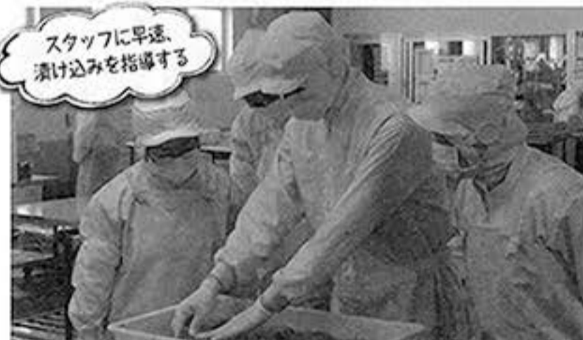
スタッフに早速、漬け込みを指導する

ここ近年の不漁もあり、採取された卵の状態が島本の基準に達していなかった為、最高の状態でご提供出来るまでじつと我慢しておりました。今年はやうやく納得のいく釣り子が入って来て、すごく興奮しています。触った感触は、釣り子の特徴でもあるデリケートな薄皮の状態や、繊細な一粒一粒の質感が手の感触と視覚からしっかりと伝わってきました。この「フチフチ感」画像ではなかなか伝わらないのが残念です…。