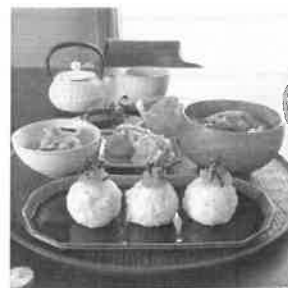
@azuredishさんの「明太オイルおにぎり」

ご飯に亜麻仁オイルを混ぜておにぎりにし、島本の明太子をトッピングしてあります！いつも素敵な朝ごはんを投稿されていて、見るたびにお腹がグッです(▽・oo)▽)