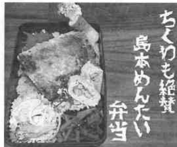
@nakano_cookingramさんの「ちくわも絶賛 島本めんたい弁当」

昨年の秋ごろから始めた島本公式Instagram (@simamoto.mentai) 少しずつ、島本の商品を投稿していただくことが増えました！そこで、島本スタッフのお気に入りの投稿をちょっとだけご紹介しちゃいます★