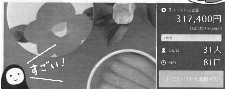
※達成時のPC画面のスクリーンショットです。

プロジェクトの公開当日。どうなることかと不安な私たちをよそに、どんどん支援して下さる方が増え、なんと、プロジェクト公開から50分で目標金額30万円を達成することができました!! さらに・・・