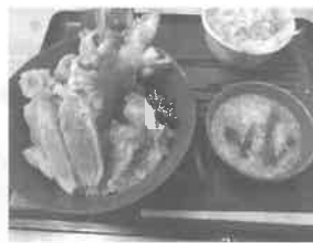
▲美味! 大ボリュームのたらこ天丼!

・・・どうにか撮影することができました! 他にも記録の大寒波に見舞われレンタカーが雪に埋もれ、初の雪かきをするようになったりしましたが、現地の協力会社さまの助けもあり、無事任務をやり遂げられました。 次回夏カタログではこのエピソードを思い出しつつご覧いただけると幸いです(笑)